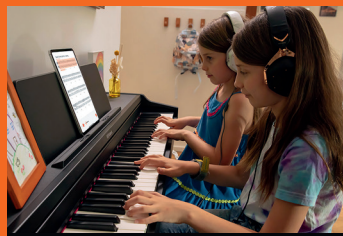
Miet-Kauf ab Fr. 30.-/Monat