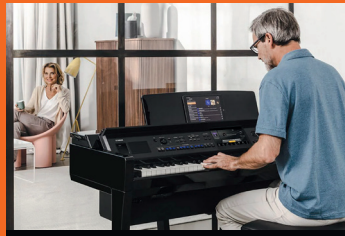
Service & Support